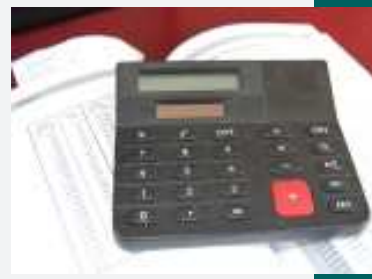
Gebühren müssen fair und berechenbar sein.