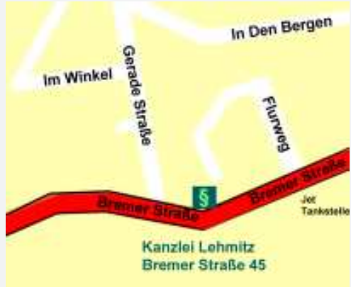
Kanzlei Lehmitz, Bremer Straße 45, 21244 Buchholz i.d.N.